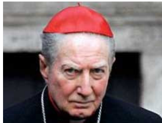
Natale: un dono dall'alto

La prima pagina è dedicata alle festività del Santo Natale e del Nuovo Anno offrendo una riflessione del cardinale Martini che ringraziamo con particolare gratitudine.